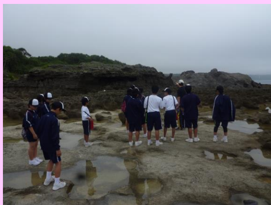
(糸家塩田後，犬田布海岸のメランジ堆積物)

宿泊学習の内容を変更して実施しました。地域散策や郷土素材を使った調理等を学習しました。