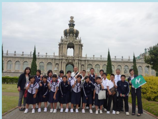
(有田ポーセリンクパーク)