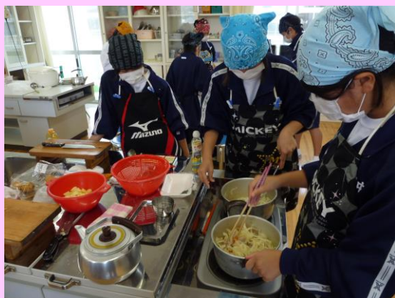
(カレーライス作り)